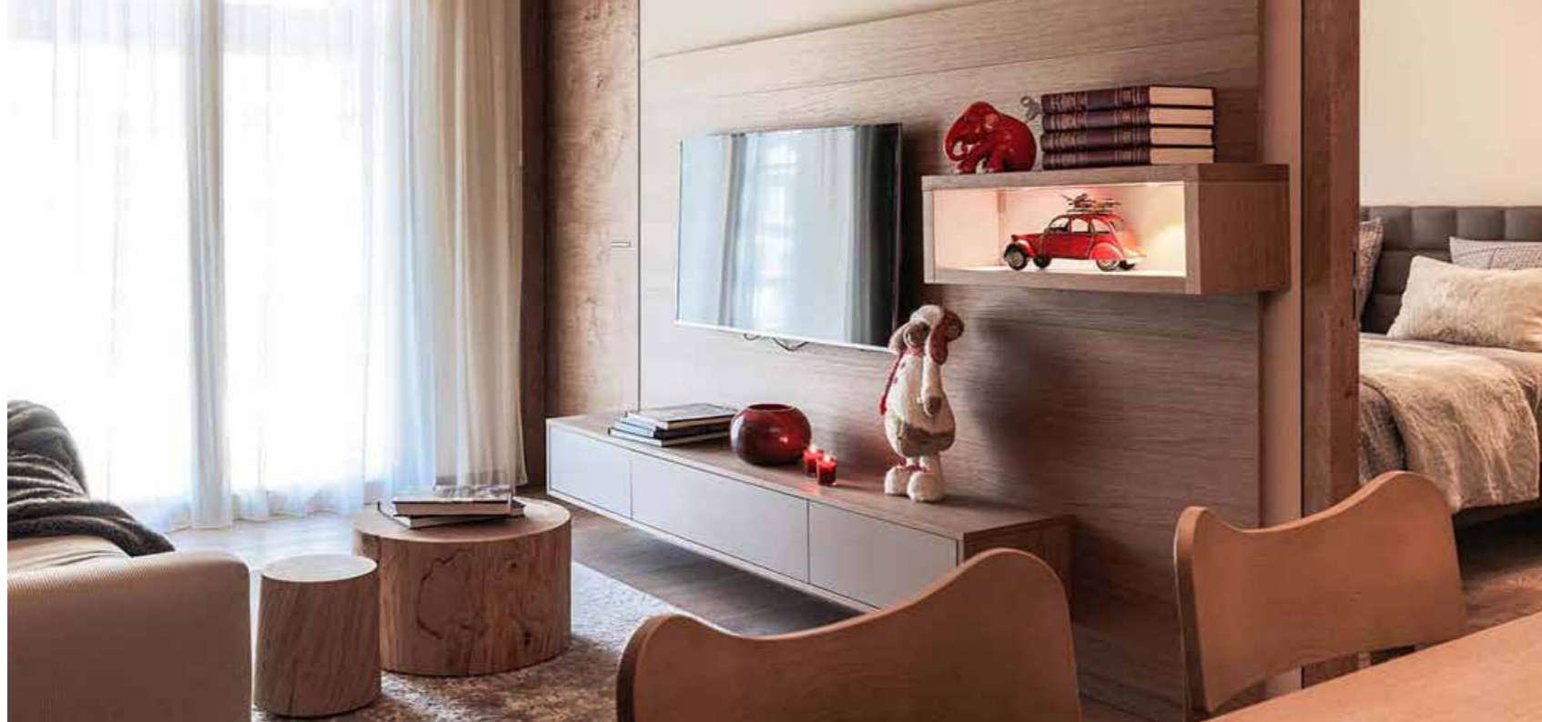
Beispielbilder / Example images